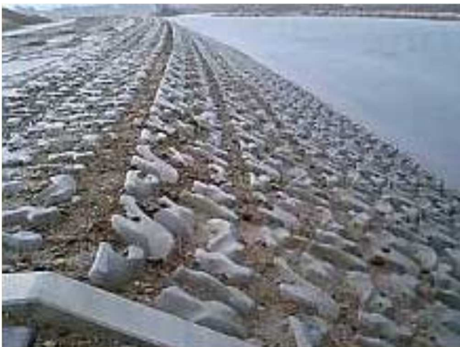
施工直後のエコアイランドマークⅡ