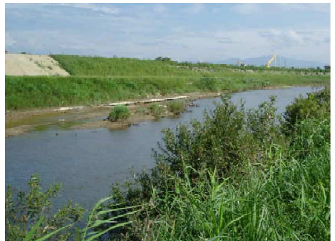
緑化により生態系にやさしい水際に