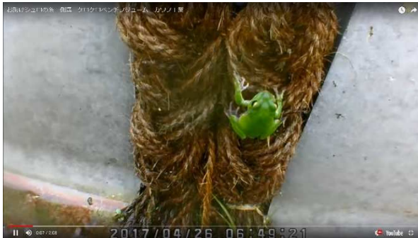
アマガエル（監視カメラ画像）

日本自然保護大賞を受賞した山口市の中学生の研究「お助け！シュロの糸」 をベースに共同開発をした環境配慮型側溝です。