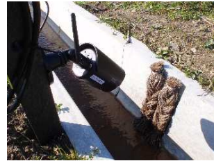
「お助けシュロの糸側溝 ケロケロベンチフリューム」