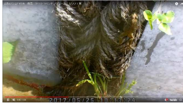
ツチガエル（監視カメラ画像）