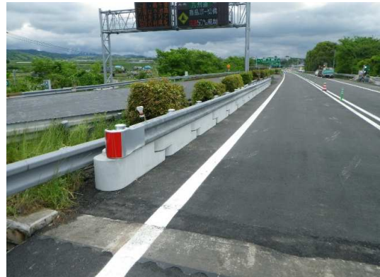
「自在R連続ガードレール基礎」