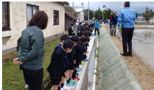
出前授業の様子（柳井市立伊陸小学校）