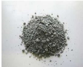
ステンレススラグ