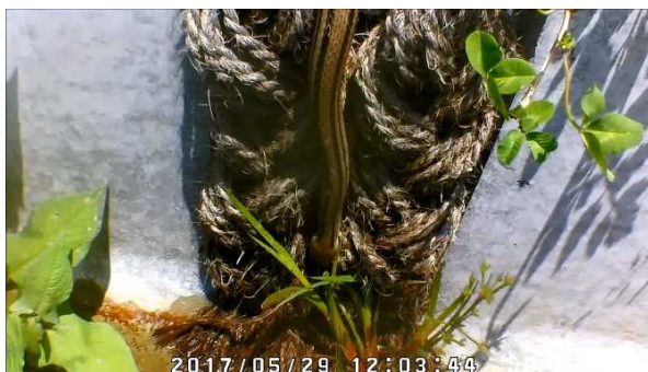
シマヘビ（監視カメラ画像）