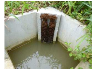
「お助けシュロの糸側溝 ケロケロ柵」